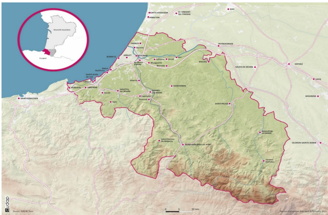
Périmètre couvert par le SCoT

Méconnu du grand public, le SCoT traite pourtant de sujets qui concernent le quotidien de tous. Eau, énergies, paysages, littoral, montagne, alimentation, agriculture, économie, commerces, mobilités, stratégies foncières, habitat... le rôle du SCoT sera de trouver le meilleur chemin pour améliorer le cadre de vie, en tenant compte des effets connus du réchauffement climatique.